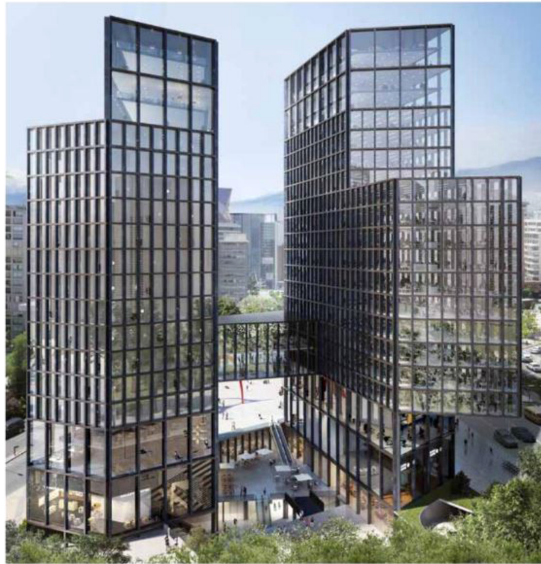
Vista Plaza Manquehue View of Manquehue Plaza

The proposal responds with a complex that assumes the diversity of situations and is capable of generating a large public space between the buildings. This operation activates the interior of the block that seems appropriate to open completely to public use. The office and hotel-residential programs were separated in two autonomous buildings, generating a junction space through a bridge at level 5. This space houses the shared uses of both programs. Between the buildings, a large public space is generated with the character of a plaza. The public space defines a new scale with a four-level height, which added to the two underground levels contain the commercial functions, an urban plinth that aims to generate an appropriate link with the built environment.