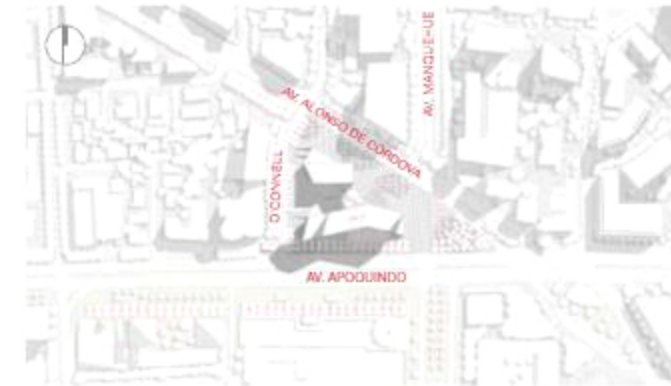
Planta contexto Context plan