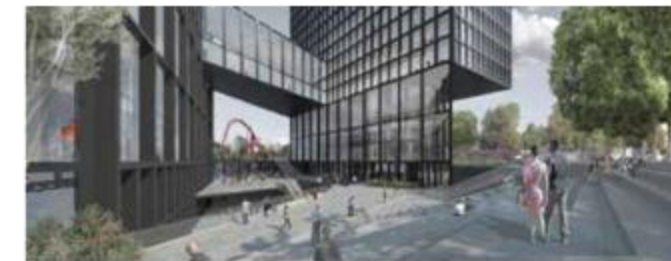
Vista calle O'Connell desde el poniente oriente View of O'Connell street from west to east