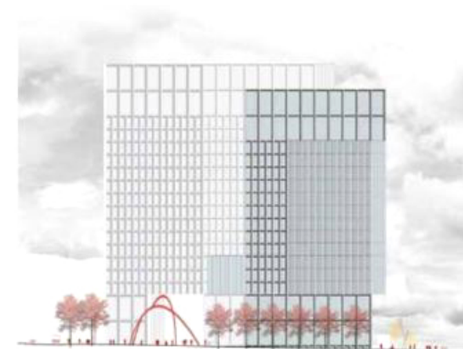
Elevación norte North elevation