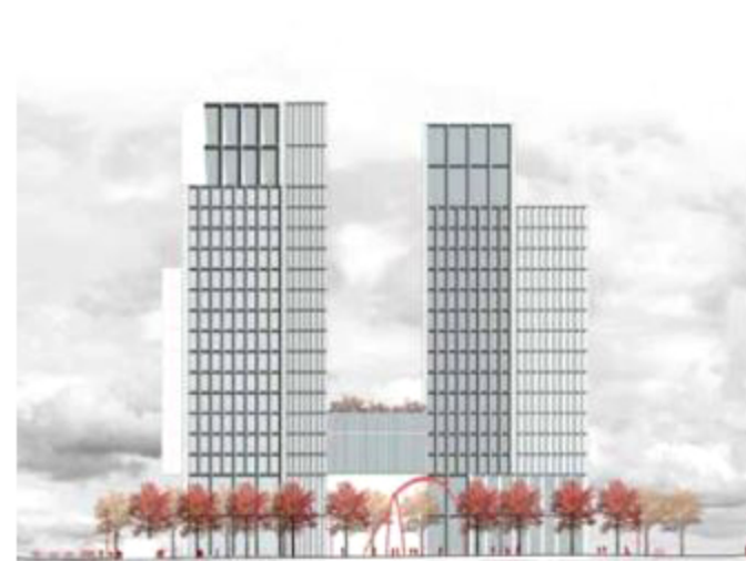
Elevación oriente East elevation