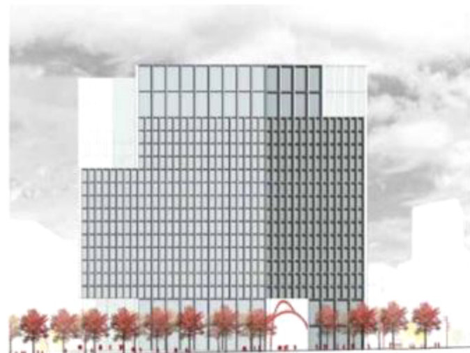
Elevación sur South elevation