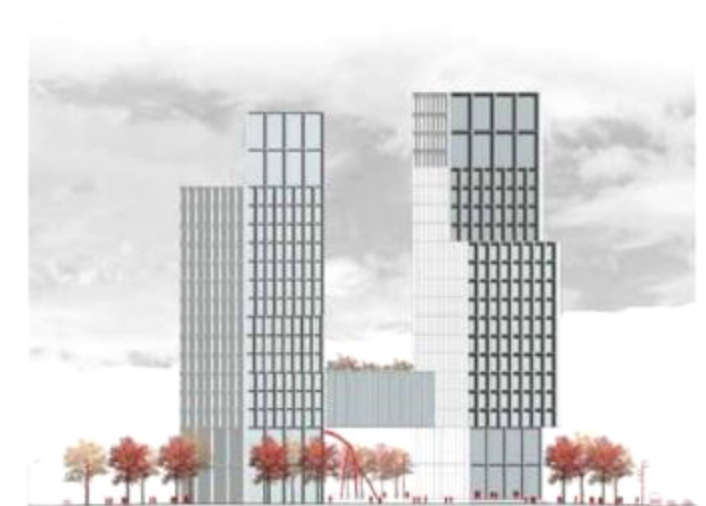
Elevación poniente West elevation